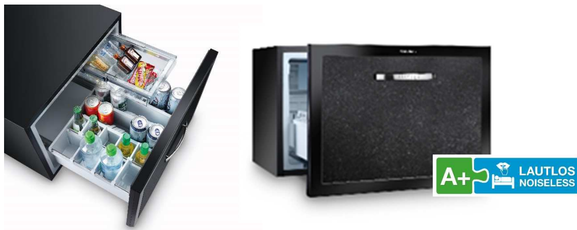
DM 50 NTE