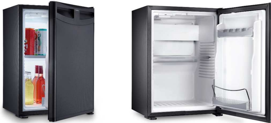
RH 548 LD